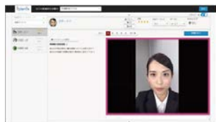
就職希望者とネットを介して面接