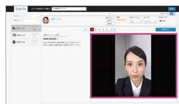
就職希望者とネットを介して面接

時間や場所を問わず、WEB上で採用面接ができるサービスです。ただ、それだけじゃないんです。録画結果から、音声・言葉・表情をAIで分析、自社で活躍する可能性をパーセンテージで自動判定してくれます。動画面接は急速に普及しています。ぜひ会場で実際の画面をご覧ください!